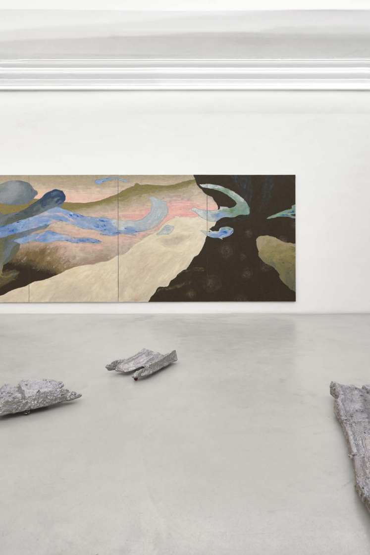
Marco Emmanuele Palmo panorama , 2025 installation view