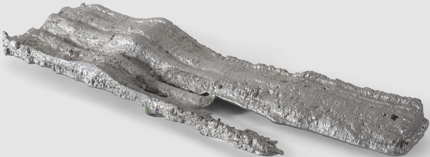
Marco Emmanuele Ruscente Insana, 2025 Aluminium and glass 94 x 11 x 28 cm