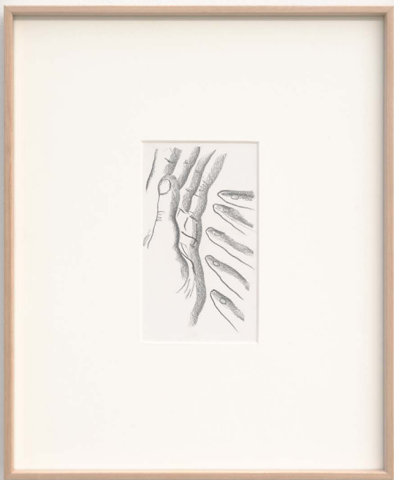
Marco Emmanuele Palm panorama, 2025 Pencil on paper 15,2 x 8,9 cm