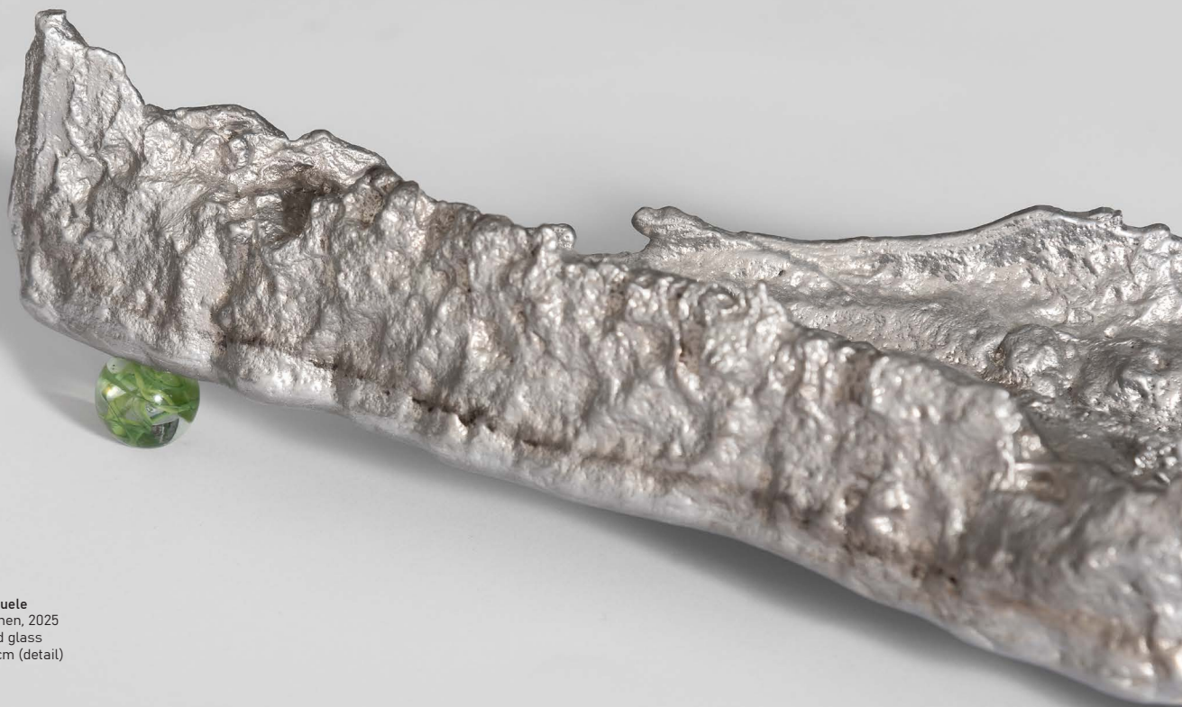
Marco Emmanuele Ruscente Zeichen, 2025 Aluminium and glass 131 x 11,5 x 30 cm (detail)